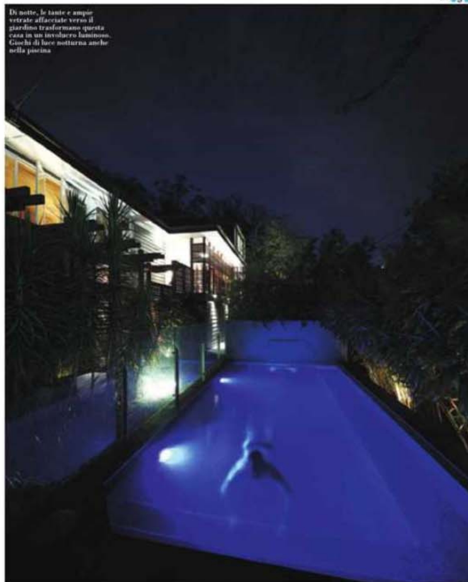
Di notte, le tante e ampie vetrate affacciate verso il giardino trasformano questa casa in un involucro luminoso. Giochi di luce notturna anche nella piscina

SHAUN LOCKYER ARCHITECTS LIGHTSPACE STUDIO 2 30 LIGHT STREET FORTITUDE VALLEY Q 4006